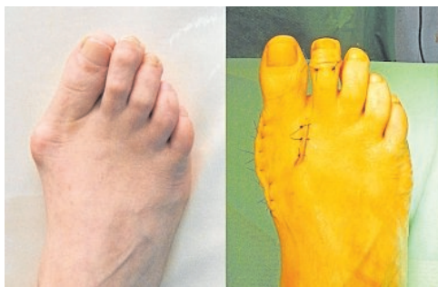
Operace deformit přednoží.

při odrazu nohy v krokovém cyklu. Naše nohy se snaží dysfunkci vykompenzovat, ale po určité době se vystupňované obranné mechanismy obrací proti nám, a nohy poškozují, což zapříčiňuje mnoho bolestivých obtíží, od patní ostruhy, po bolesti achilovky. Funkční ortopedické vložky revitalizují a aktivují přirozenou biomechaniku chůze, ponoukají nohy, aby se samy zase vrátili ke přirozenějšímu pohybu.